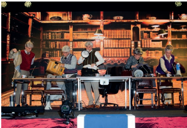
De 'Dorpsraad' vergadert in de Zjwamer Revu "Sjeet op!!"

op een humoristische wijze voor het voetlicht werden gebracht. De Dorpsraad heeft blijkbaar een gewaardeerde plaats in de Swalmer gemeenschap verworven! Een groot compliment voor iedereen die hieraan heeft meegewerkt.