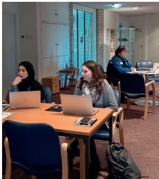
Inlooppreekur van de politie/handhaving en VIJF

2022 was een jaar om na corona de activiteiten weer opnieuw op te starten. In de loop van de tijd vonden bezoekers ook weer hun weg terug naar de Laeskamer om een boek te lenen, een activiteit bij te wonen, de krant te lezen of om even met een kopje koffie een praatje te maken met een van de gastvrouwen in een warme omgeving. Men kon dan thuis de verwarming een paar graden lager zetten wat in de laatste maanden van het jaar een welkome besparing was omdat de energieprijzen de pan uit rezen.