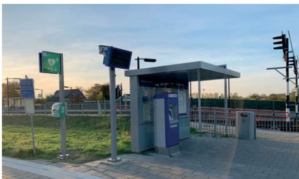
AED bij het station

Op woensdag 11 mei 2022 organiseerde de Dorpsraad (werkgroep Hartveilig Swalmen) in samenwerking met Stichting Hart voor de Buurt/Hart voor Limburg en de EHBO-vereniging Swalmen/Maasniel in De Robijn een informatieavond reanimatie/AED en hoe je burgerhulpverlener kunt worden bij HartslagNu. Dat hiervoor belangstelling was bleek al eerder toen na een artikel in de Zjwamer Gezet over de oprichting van de werkgroep Hartveilig Swalmen tientallen aanmeldingen binnenstroomden voor deze cursus. Tijdens de avond zelf kwamen er nog veel aanmeldingen bij (waaronder 9 ondernemers die vanuit BIZ Centrum meededen, mede omdat er sinds 2022 een AED buiten hangt bij Jan Linders).