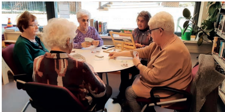
Gezellig kaarten in de Laeskamer

Deze ruimte wordt ook gebruikt door VIJF om het project met 'vrouwelijke statushouders' door te ontwikkelen om inburgering in de gemeenschap en het beheersen van de Nederlandse taal te bevorderen (onderdeel van de Participatiewet). De Laeskamer is ook de vergaderruimte voor en het thuishonk van het bestuur van de Dorpsraad.