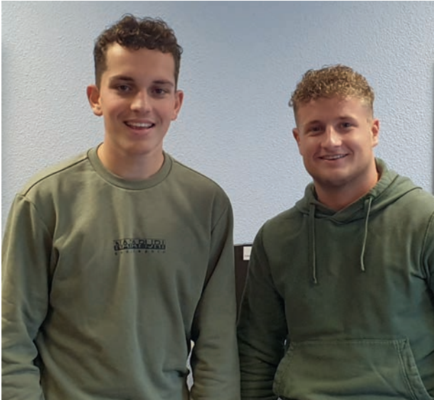
Leerlingen van de Gilde Opleidingen die ondersteuning bieden bij digitale problemen

De leerlingen worden door hun school begeleid en mogen zich niet met privacygevoelige zaken bezighouden. Voor het aanmaken van een DigiD bijvoorbeeld of andere 'discrete' zaken kunnen inwoners op de dinsdagmiddag terecht bij VIJF. Bezoekers die geholpen werden met hun probleem zijn erg enthousiast over deze nieuwe service.