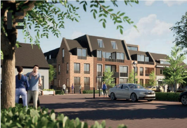
Artistieke impressie van de bouwplannen

een speerpunt is en elk initiatief tot het bouwen van nieuwe woningen in Swalmen juichen wij toe. Op de Bosstraat is een bouwproject bijna klaar en het andere start binnenkort. Er liggen inmiddels plannen voor zo'n kleine 50 woningen/ appartementen en die zijn hard nodig in Swalmen om te voorkomen dat de jongeren én ouderen Swalmen verlaten omdat hier geen (betaalbare en levensloopbestendige) woningen beschikbaar zijn.