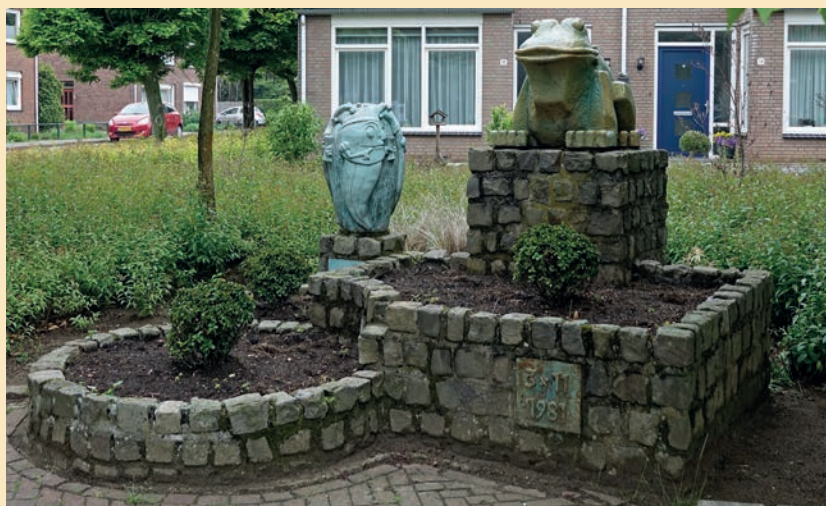
Kwekkerte- en Kuulköpkesmonument