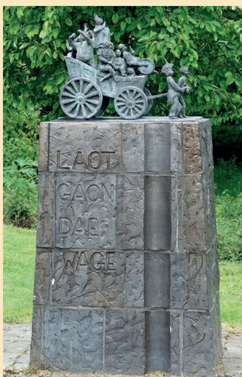
Hopslokkers- monument 'Laot gaon dae wage'