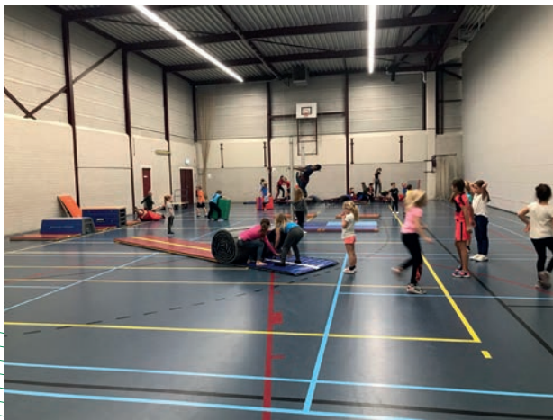
Gratis sport en spelmiddag voor de Swalmer basisschooll leerlingen

Voor 2022 is nog een bedrag van € 5.455,- beschikbaar.