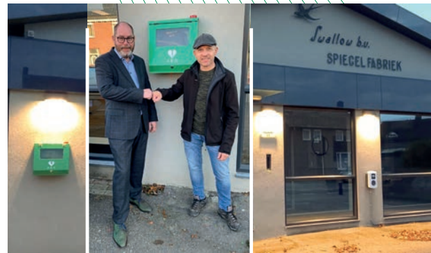
Plaatsen van een AED op de buitengevel

Ook in 2021 hebben wij - in samenwerking met BIZ Centrum Swalmen - voor een bijdrage van € 1.000,- voor een mooie kerstverlichting gezorgd. Het initiatief voor een 1 e Zjwamer Kerstsfeer Wandelroute kon rekenen op financiële ondersteuning en de begroting van € 375,- werd dan ook goedgekeurd.