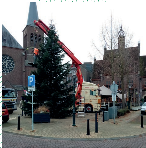
De kerstboom op de Markt wordt geplaatst