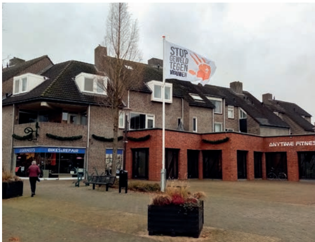
Uw vlag op het Crasbornplein

Mede door het bovenstaande is er een 'huurdersoverleg' in het leven geroepen, waaraan ook de verhuurder deelneemt. Binnen dit overleg worden over en weer afspraken gemaakt met de (ver)huurder(s) over het gebruik en onderhoud van de ruimten.