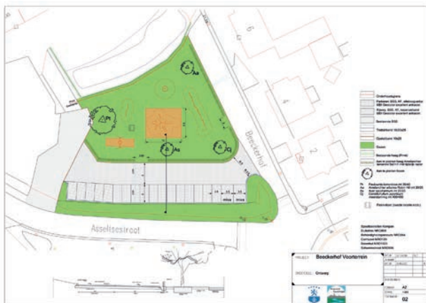
Situatietekening voorterrein Beeckerhof

Reeds in 2013 zijn plannen gemaakt voor het verfraaien van de entree van Swalmen rond de parkeerplaats Beeckerhof. Omdat het parkeerterrein werd gebruikt voor opslag en stalling in verband met diverse werkzaamheden in de omgeving, werden de plannen steeds opgeschoven.