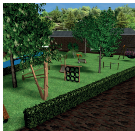
Tekeningen van de indeling van speeltoestellen, bomen en beplanting. gemaakt door Boesheide Hoveniers